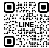
【↑公式 LINE QR コード】